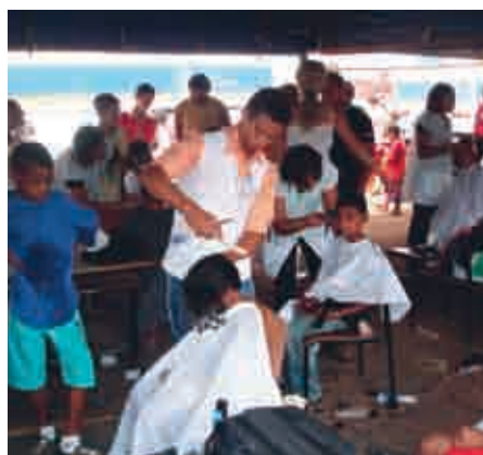
Moradores da Vila Estrutural receberam atendimento dos alunos durante o evento

A Faculdade de Tecnologia Senac/DF (FacSenac) participou, no dia 27 de outubro, do Dia da Responsabilidade Social do Ensino Superior Particular, promovendo, em parceria com outras empresas, um grande evento de inclusão social e cidadania na Vila Estrutural. O Trote Solidário foi realizado na Escola Classe 01, localizada na entrada da Vila, próximo ao posto de saúde da comunidade. Os alunos da FacSenac, além de voluntários, foram responsáveis por várias oficinas e outras ações no local.