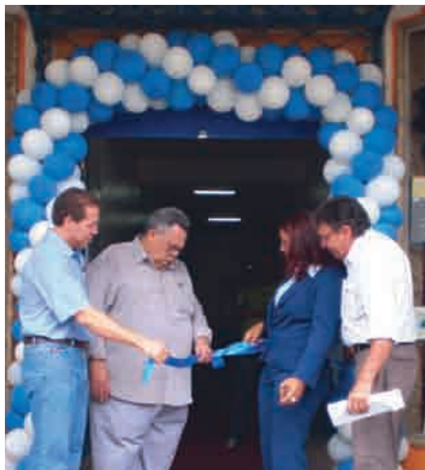
Inauguração da unidade Jatuarana

Em Rondônia, o Senac oferece uma política de descontos diferenciada para que os residentes dos bairros próximos a esses novos centros tenham mais facilidade para se capacitar para o mercado de trabalho. Outro ponto a ser destacado é que as três novas unidades servem de apoio ao Plano Setorial de Qualificação Hidrelétrica (Planseq),