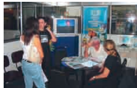
Técnicos do Senac dão orientação aos visitantes no estande