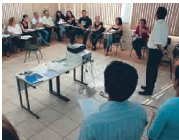
Oficina Atendimento ao Cliente, em Tocantins